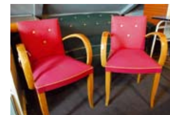
Wish barn , Wish street, T. 01797 22 67 97, http://wishbarnantiques.co.uk